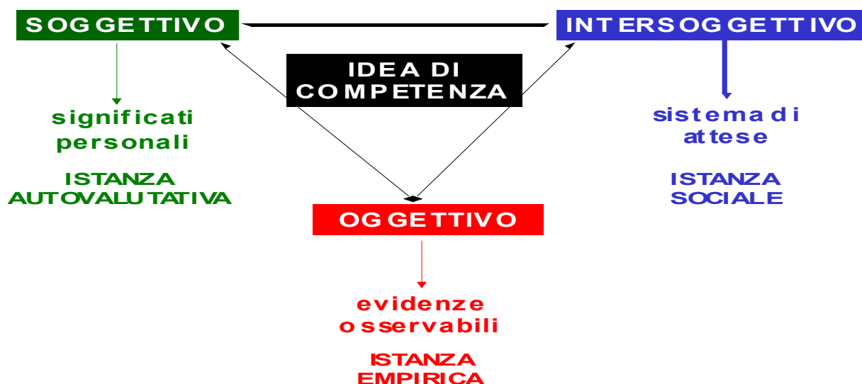
Tav. 2 Prospettive di valutazione della competenza.

La Tav. 2 sintetizza l'impianto di indagine proposto: una valutazione di competenza richiede di attivare simultaneamente le tre dimensioni di analisi richiamate, attraverso uno sguardo trifocale in grado di comporre un quadro di insieme e di restituire le diverse componenti della competenza richiamate nell'immagine dell'iceberg, sia quelle più visibili e manifeste, sia quelle implicite e latenti. Il rigore della valutazione consiste proprio nella considerazione e nel confronto incrociato tra le diverse prospettive, in modo da riconoscere analogie e differenze, conferme e scarti tra i dati e le informazioni raccolte. Solo la ricomposizione delle diverse dimensioni può restituire una visione olistica della competenza raggiunta, riesce a ricomporre l'immagine dell'iceberg nella sua complessità.